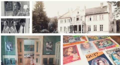
Romy Schneider Museum Schloss Klein Loitz

Das Museum präsentiert in einer Ausstellung das soziale Engagement der Schauspielerin. Romy Schneider engagierte sich für Künstlerinnen und Künstler der DDR, für Personen, die in der DDR unter Berufsverboten litten. Zu jeder vollen Stunde wird eine Dokumentation zur Ausstellung in bewegten Bildern gezeigt.